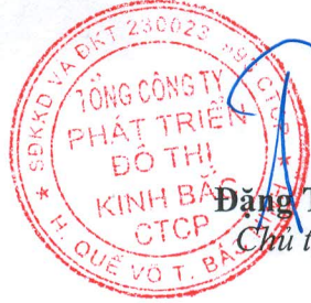
Đặng Thành Tâm Chủ tịch HĐQT