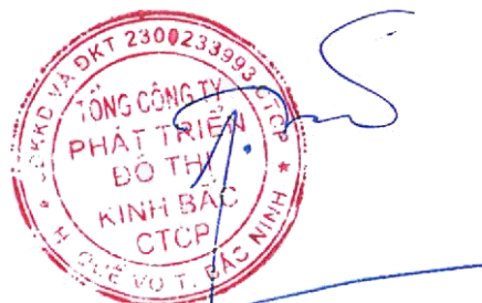
Đặng Thành Tâm